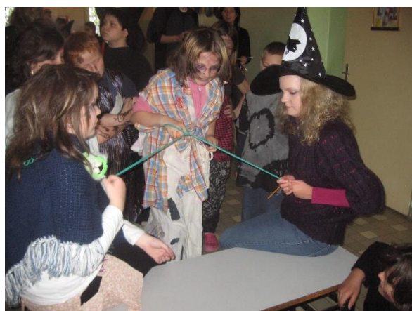
Čarodějny den – květen 2013