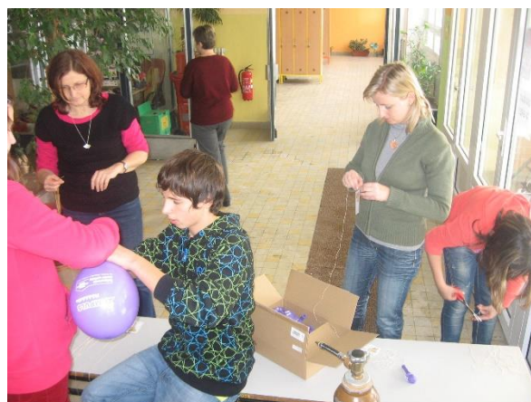
Balónky Ježíškovi – prosinec 2012