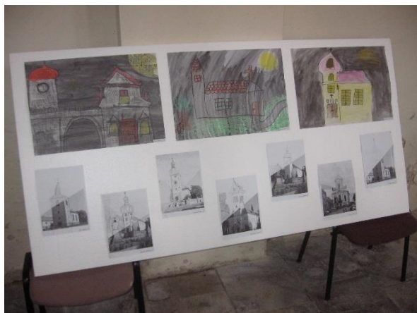
Výstava Noc kostelů – květen 2013