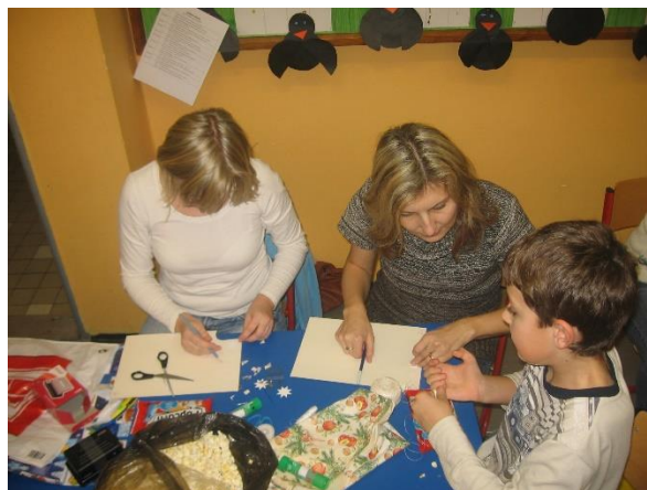
Setkání rodičů s dětmi – prosinec 2012