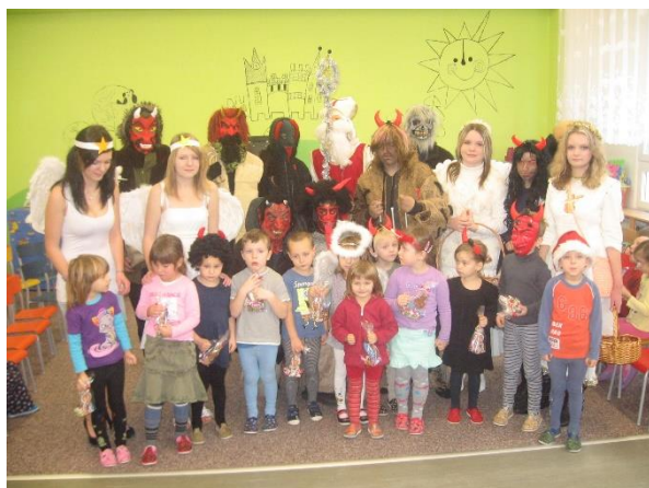
Mikuláš 2012 – prosinec 2012