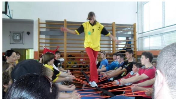
Hry bez hranic – červen 2013