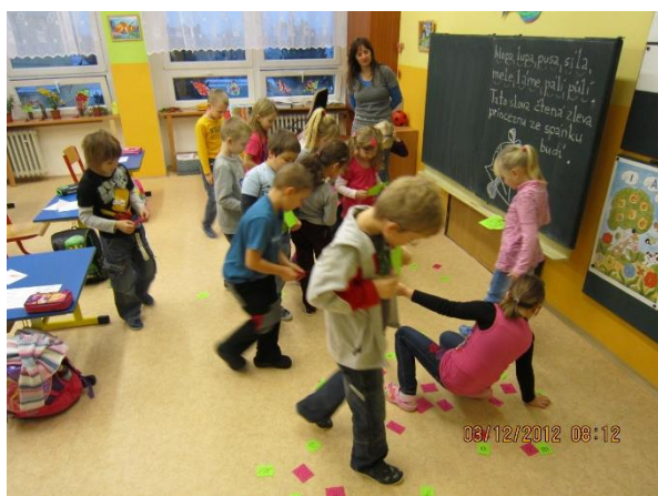
Slavnost slabikáře – prosinec 2012