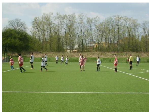
Coca Cola Cup – říjen 2012