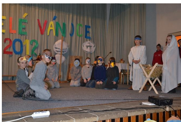
Vánoční akademie – prosinec 2012