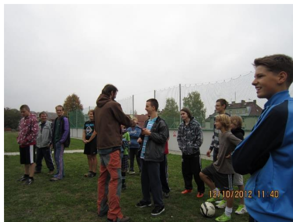
72 hodin proti Ihostejnosti – říjen 2012