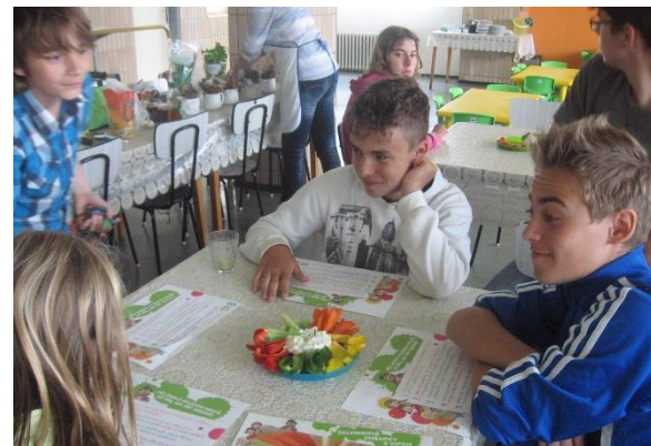
Projekt Zdravá pětka – květen 2013