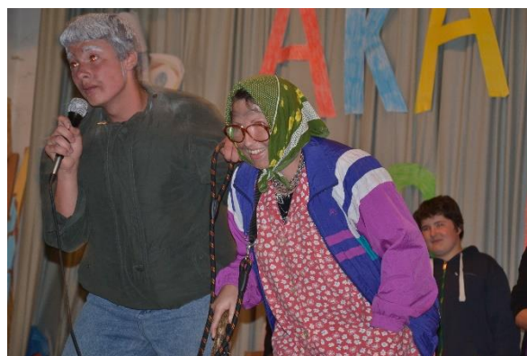
Akademie, konec školního roku – červen 2013