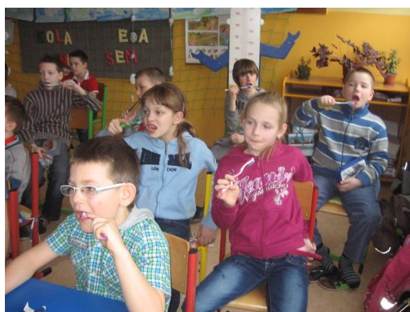
Veselé zoubky – březen 2013